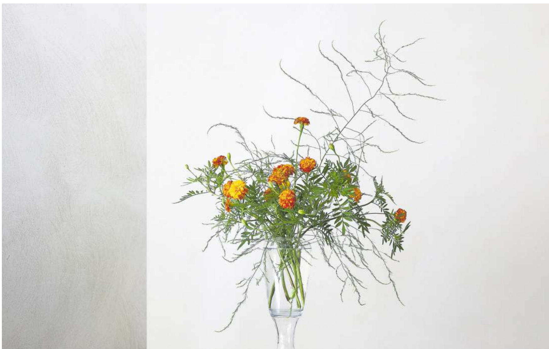
Lieblingsaufnahmen namhafter Schweizer Architektur Fotografen: Auch Blumen können Architektur verdeutlichen – hier die Mauern von Sempers Villa Garbald in Castasegna.